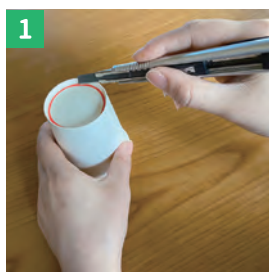
紙コップを縦半分切る (写真の赤い線)