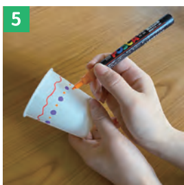
紙コップに好きな模様を描く