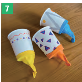
切り取ったコップの底に 風船をかぶせる