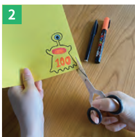
色画用紙にモンスターや オバケなどのまとなる絵を描く 点数をかくと楽しく遊べるよ!