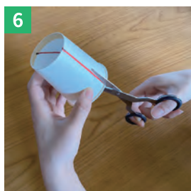
紙コップの底をカッターで切り取る ※危ないので、おうちの人にやってもらってね