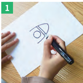
1 ロケットとロボットの絵を描く 色も塗ってカッコよくしてみよう！