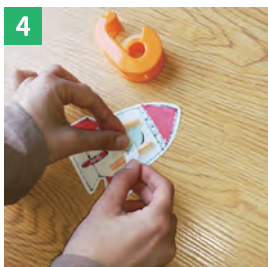
4 ストローをテープでとめる 画用紙の裏側にしっかりテープで とめます