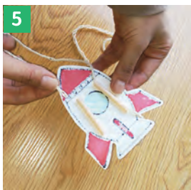
5 たこ糸を通す ストローにたこ糸を通します ※上に進む方がツリになるように…